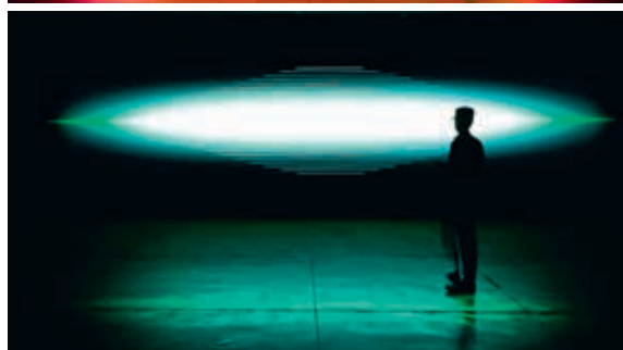
© Kurt Hentschläger